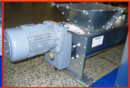
Závitkový dopravník žľabový DZ 200 - pozinkovaný