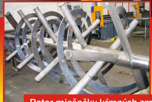
Rotor miešačky krmných zmesí