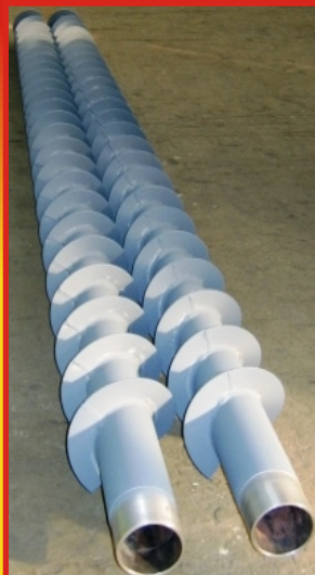
Závitovka do posýpacích vozov