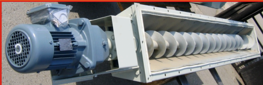
Závitkový dopravník pod filter