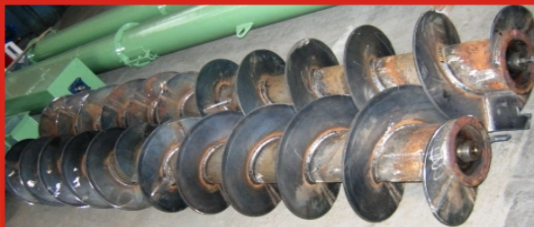
Závitovka do miešacieho krmneho vozu